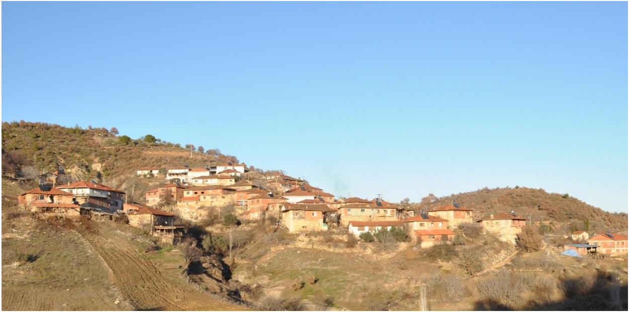
Fotoğraf No.2 Karataş Nahiyesi Köylerinden Marmaracık Köyünün Günümüzdeki Görüntüsü.