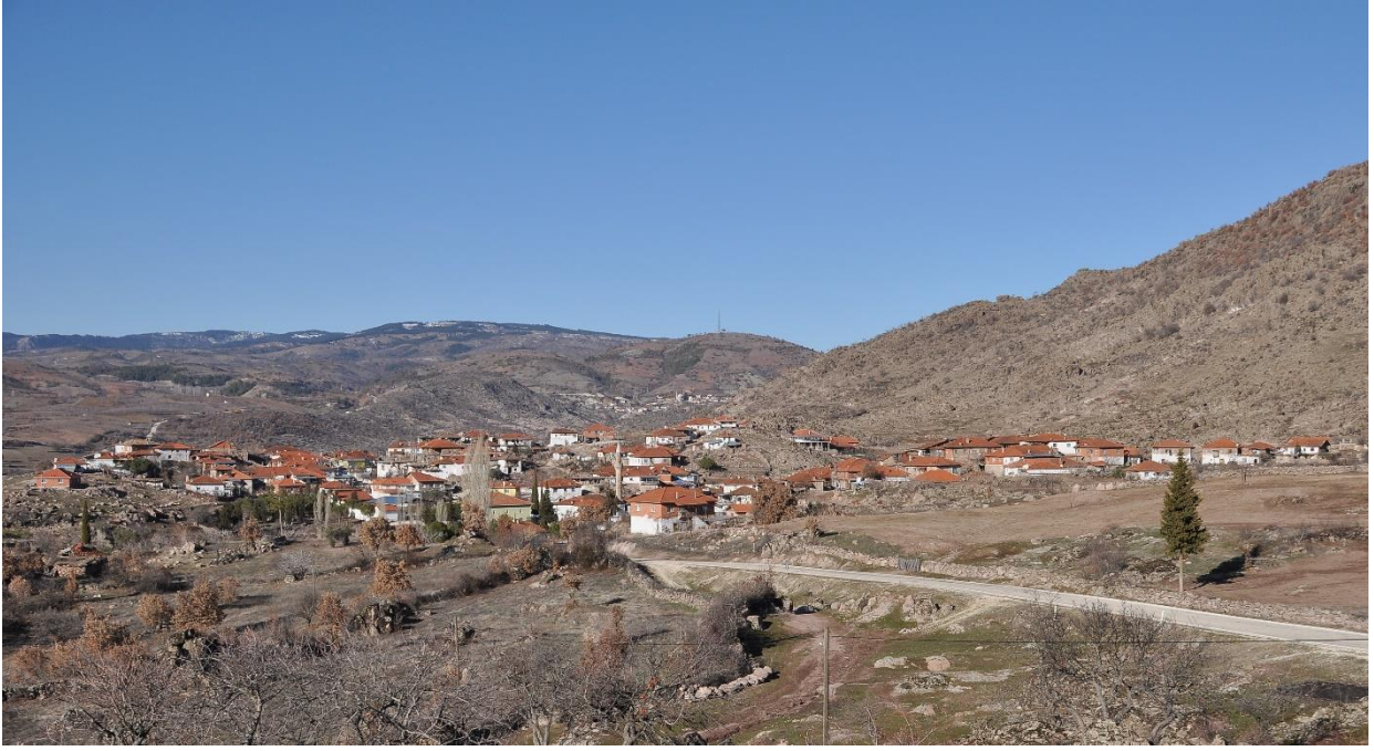
Fotoğraf No.1 Karataş Nahiyesi Köylerinden Boyacık Köyünün Günümüzdeki Görüntüsü